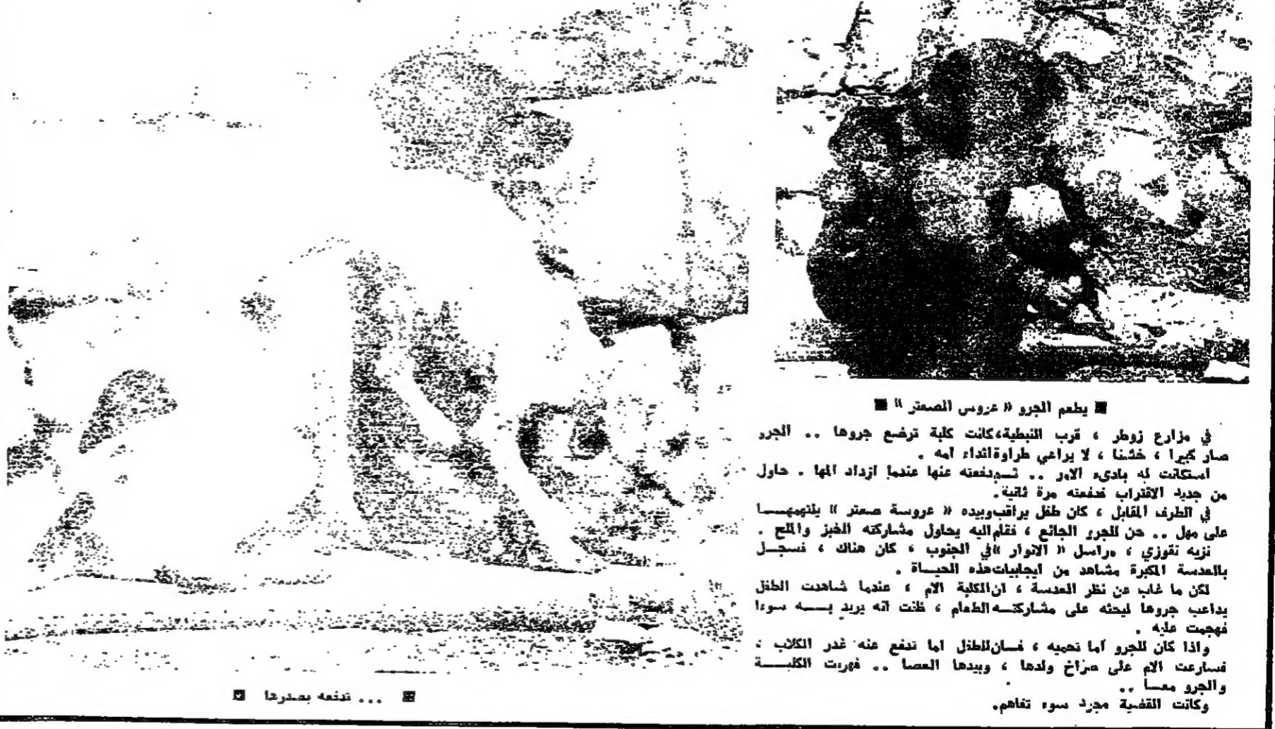
الكلبة تعرض جروها

يطعم الجرو « عروس الصخر » في مزارع زوطر ، قرب النبطية، كانت كلبه ترضع جروها .. الجرد صار كبيرا ، خشنا ، لا يراعي طراوة اعداء امه . استكثرت له ياديه الارز .. تسدغته عنها عندما ازداد انها . حاول من جديد الاقتراب فلفته مرة ثانية . في الطرف المقابل ، كان طفل يرتاض ويديه « عروسه صخر » بلنبيها على مول .. من الجرد الجائع ، فقام اليه يحاول مشاركته الخبز والمكح . تزده توتوزي ، مرسل « الانوار » في الجنوب ، كان هناك ، تسجل بالعدسة الكبرة مشاهد من ايجليات هذه الحياة . لكن ما غاب من نظر العدسة ، ان الكلبه الام ، عندما شاهدت الطفل يداعب جروها ليحطه على مشاركته الطعام ، ظنت انه يريد بسفه سورا فهجرت مده . واذا كان للجرو اما نصيبه ، فسان لطنل اما تدفع عنه فخر الكلاب . تسارعت الام على سزاح ولدها ، ويدها العسا .. فهورت الكلبه والجرو معا .. وكانت القضية مجرد سوء تفاهم .